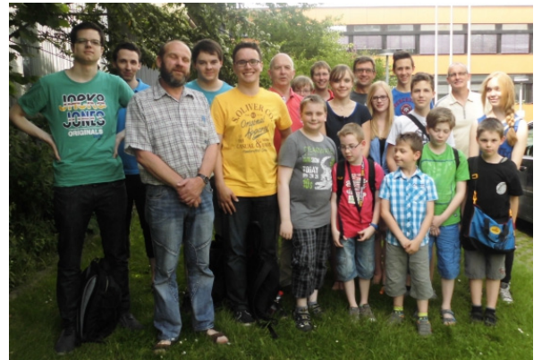
20 Teilnehmer des Lüner Schnellschach Open kamen aus Waltrop - dafür gab's mal wieder den Sonderpreis!